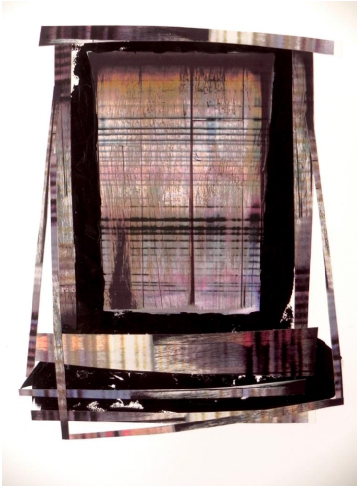
Pierpaolo Fassetta architetture effimere # 03 / ephemeral architectures # 03 2018 / 2018 Photo collage Wooden frame 50 x 70 cm Piece unique 1/1 3.000 €