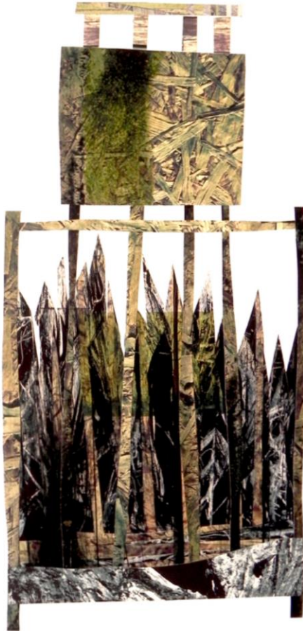
Pierpaolo Fassetta architetture effimere # 06 / ephemeral architectures # 06 2018 / 2018 Photo collage Wooden frame 50 x 70 cm Piece unique 1/1 3.000 €