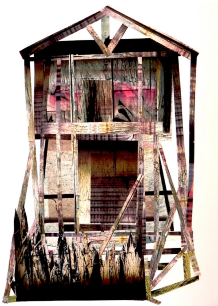
Pierpaolo Fassetta architetture effimere # 02 / ephemeral architectures # 02 2018 / 2018 Photo collage Wooden frame 50 x 70 cm Piece unique 1/1 3.000 €