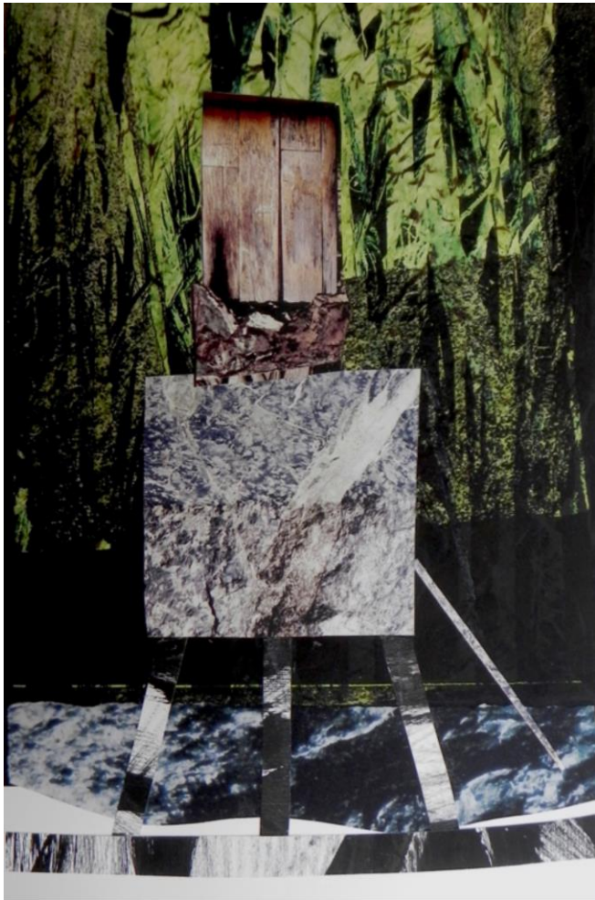
Pierpaolo Fassetta architetture effimere # 08 / ephemeral architectures # 08 2018 / 2018 Photo collage Wooden frame 50 x 70 cm Piece unique 1/1 3.000 €