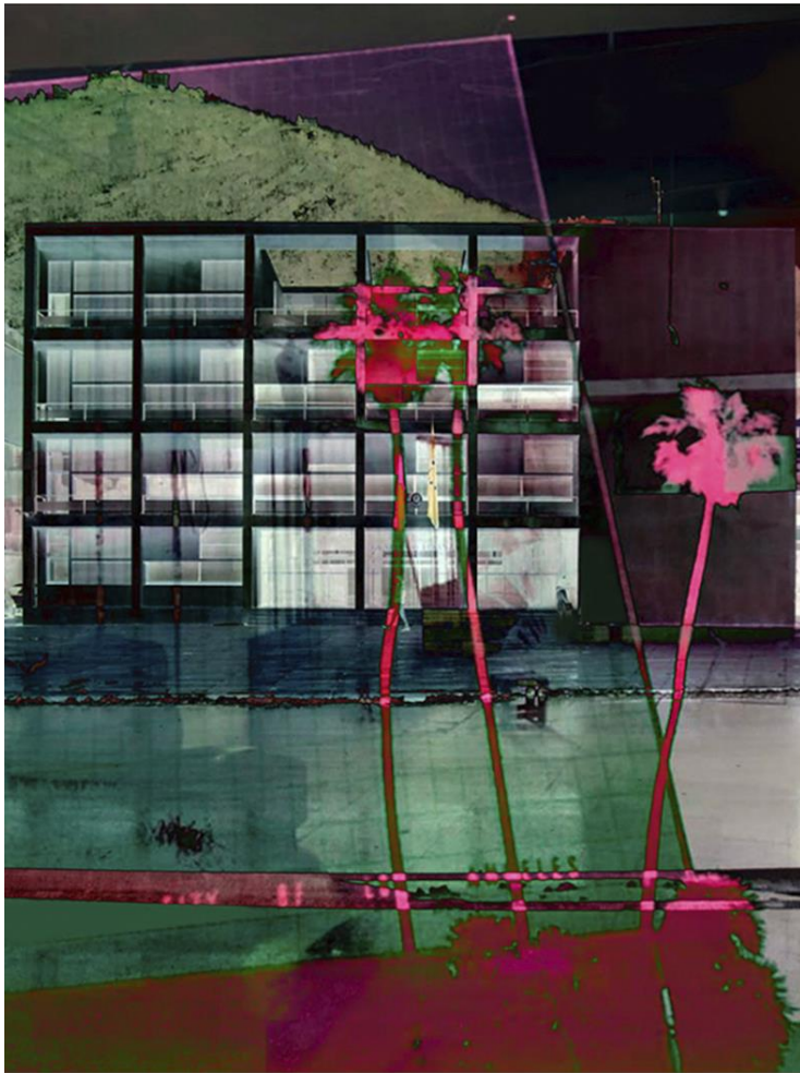
Gianna Spirito Il colore del razionalismo #4 / The Colour of Rationalism #4 2020 / 2024 Pigment inkjet printing (Giclée) Paper Canson Platine Fibre Rag 310 gsm on Dibond iron-on wood frame 60 x 80 cm 2/10 (+ 1 AP) 2.500 €